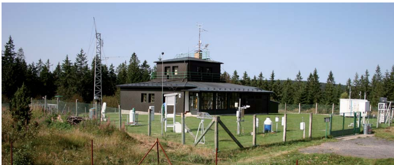
Obr. 2 Meteorologická stanice Churáňov.