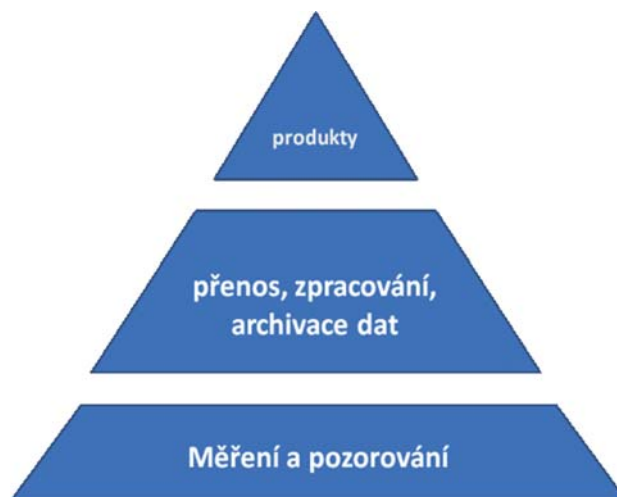
Obr. 1 Meteorologicko-klimatologická pyramida.

Kromě základních meteorologických prvků (teplota a vlhkost vzduchu, směr a rychlost větru, tlak vzduchu, sluneční svit, teplota půdy a srážky) získaly i zcela novou generaci přístrojů na měření druhu a výšky oblačnosti (ceilometr), meteorologických jevů (present weather detector) a na některých jsou dnes i výparoměr, solarimetr, sněhoměrný auto-